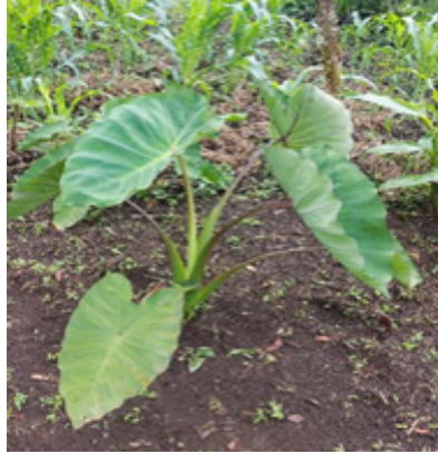
Malanga Morada, Ox