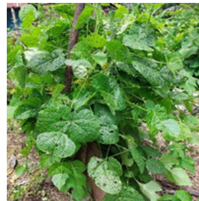
Frijol piloy, Nun