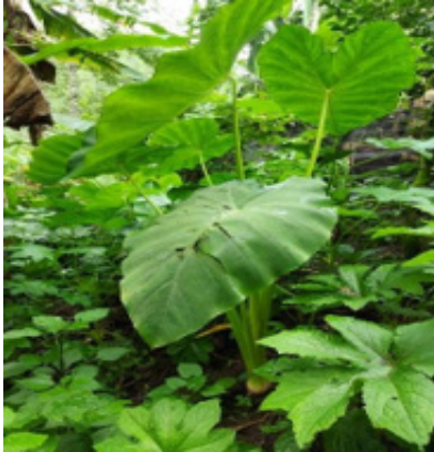
Malanga blanca, Saqui Ox