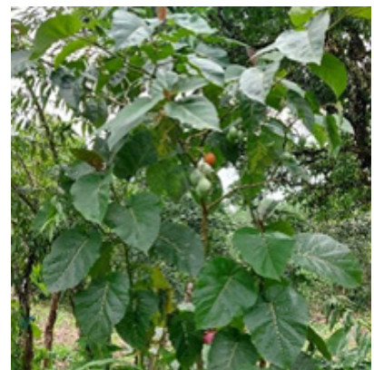
Tomate de árbol, Che pix