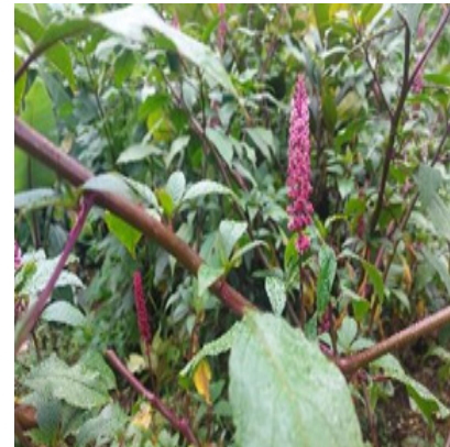
Zorro de monte

Las plantas nativas cultivadas en los hogares son el güisquil (93%), macuy (85%), tzoloj (60%), bledo (56%), frijol nun (53%), el tomate de árbol (52%), malanga morada (47%), roq'tix (40%), pacaya (39%), tziton (38%), malanga blanca (33%), miltomate (30%), camote (20%), chipilín (13%), naranjilla (13%), ayote (12%), chilacayote (8%), rechacho (6%), güicoy (5%) y mora silvestre (2%).